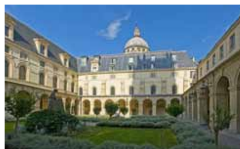
Cloître du Lycée Henri-IV

Le programme, cette année, sera placé sous le thème de « la correspondance », choisi par le Ministère. Signatures, lectures épistolaires, ateliers de dessin et d'écriture... seront proposés au public, dans le cloître du Lycée, pour compléter la découverte des ouvrages. Deux concerts solidaires pour le Japon et le Vietnam, seront organisés au profit de la Croix-Rouge et de l'association SEME, dans la Chapelle du Lycée.