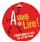
À vous de lire